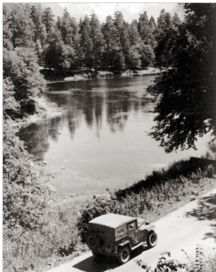
Тебердинский государственный заповедник. Озеро Кара-Кель. 1956 год