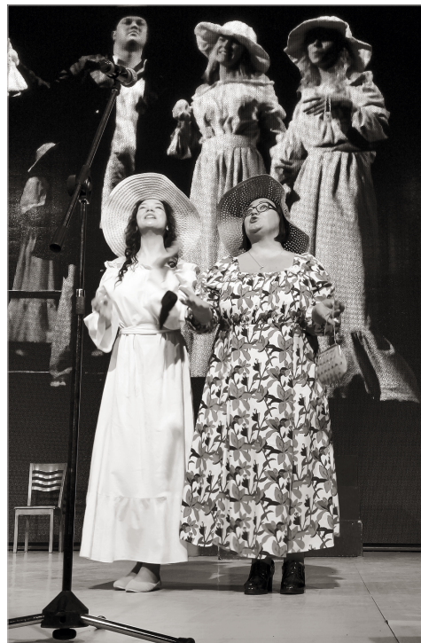
Сцена из спектакля «С-Ума-Шествие»