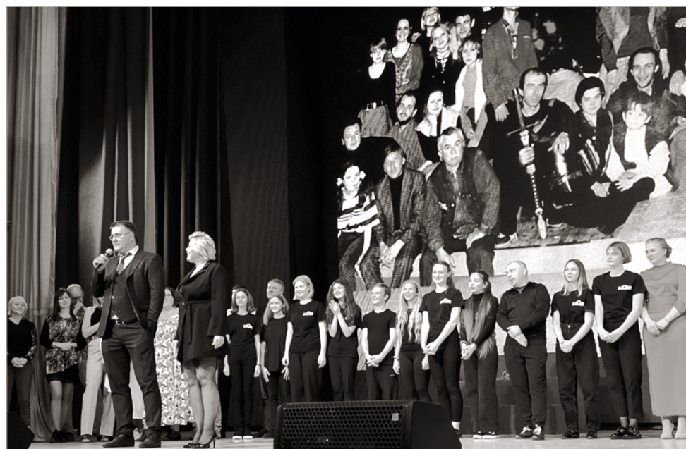
Театр-студия «Слово» на родной сцене