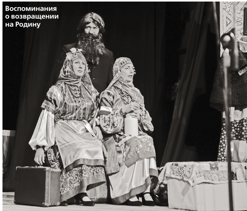
Воспоминания о возвращении на Родину