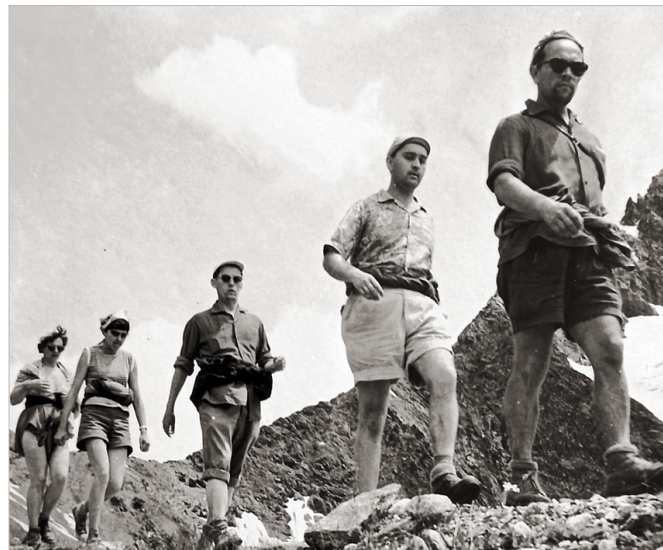
Польские туристы во время похода по Тебердинскому государственному заповеднику. 1961 год