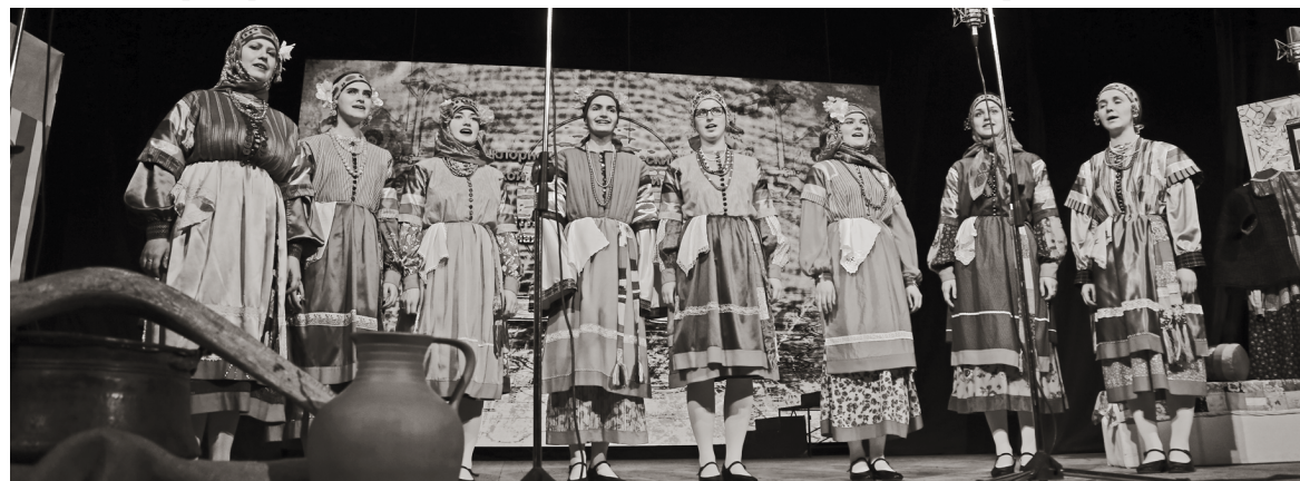
Песню некрасовских казаков исполняют студентки Гнесинской академии музыки

На снимках запечатлены фрагменты спектакля-концерта «Культурное наследие казаков-некрасовцев», который представили на сцене филармонии ведущие фольклорные и казачьи ансамбли Ставрополя и студенты легендарной Гнесинки. Получилось поэтическое повествование о возвращении на Родину. С момента возвращения из Турции казаков-некрасовцев прошло 60 лет.